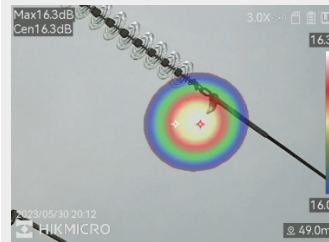
Detección de descarga parcial