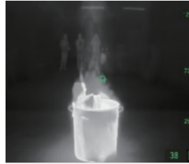
Negro & Blanco

Para operaciones iniciales de rescate y contra incendios; los colores representan la temperatura.