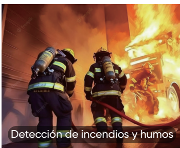
Detección de incendios y humos