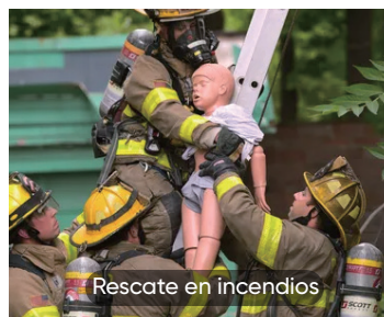
Rescate en incendios