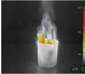
Detección de fuego

Para escenarios con temperaturas de fondo más altas donde hay exposición de llamas, especialmente en incendios estructurales.